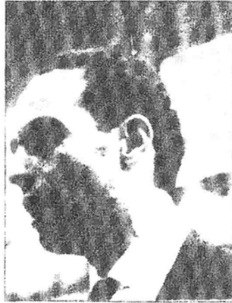
المحجوب بن الصديق

ومن جهة أخرى، فإن أربعين نقابيا اعتقلوا ووضعوا تحت الحراسة بسبب تنظيم تجمعات نقابية في شأن المحجوب بن الصديق، وكأن الحدث هذا كان حدثا عابرا، ويعني بأن الاتحاد المغربي للشغل كان في سقوط متزايد وأصبح المحجوب منذ ذلك الوقت ليس له وزن رغم ماضيه الطويل في الحقل النقابي والسياسي بالمغرب كما سيحدث لكل من يتبجح بالزعامة السياسية والنقابية في عهد الحسن الثاني.